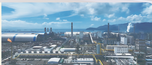
印度尼西亞蘇拉威西